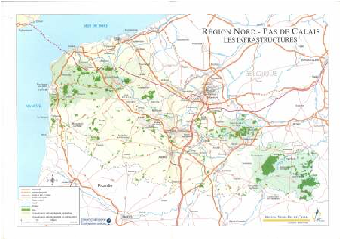
1. Ábra: Nord-Pas-de-Calais régió, Franciaország

Az utóbbi két évtizedben e tekintetben növekvő tendenciát figyelhetünk meg: a 2000. év küszöbén a Belgiumban tanuló francia diákok száma elérte a tízezres nagyságrendet. A növekedés azonban csak egy irányban jellemző, belga diákokat elvéve találni francia iskolákban. Jellemzően francia diákok iratkoznak be nagy számban belga oktatási intézménybe.